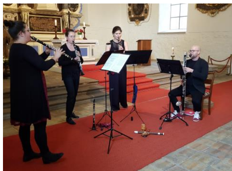
Klarinettenquartett 3plus1 in Wiehe