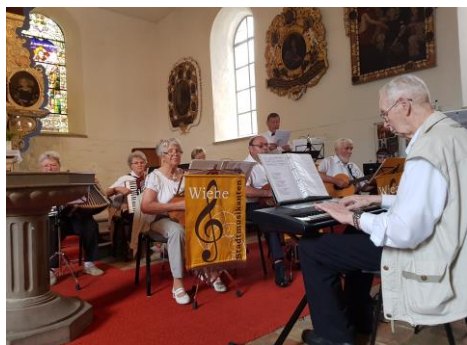
Pfarrgartenfest mit den Stadtmusikanten Wiehe