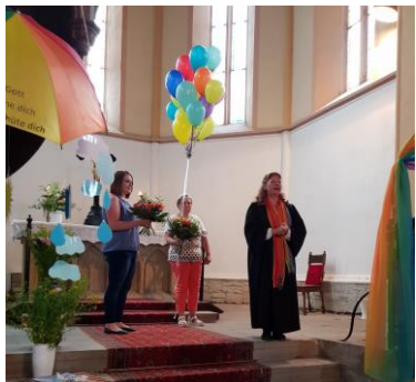
Finneck-Gottesdienst in Gehofen