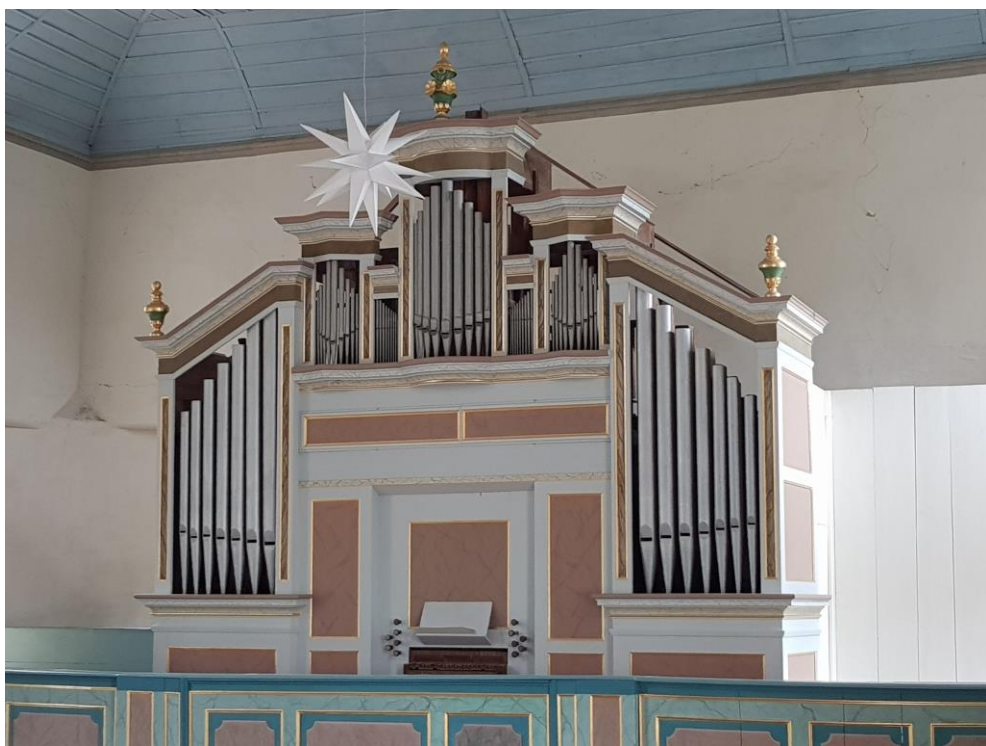
Orgel der St. Laurentius-Kirche in Kloster Donndorf

für die Kirchengemeinden Allerstedt, Donndorf, Garnbach, Gehofen/Nausitz, Kloster Donndorf/Kleinroda, Langenroda und Wiehe