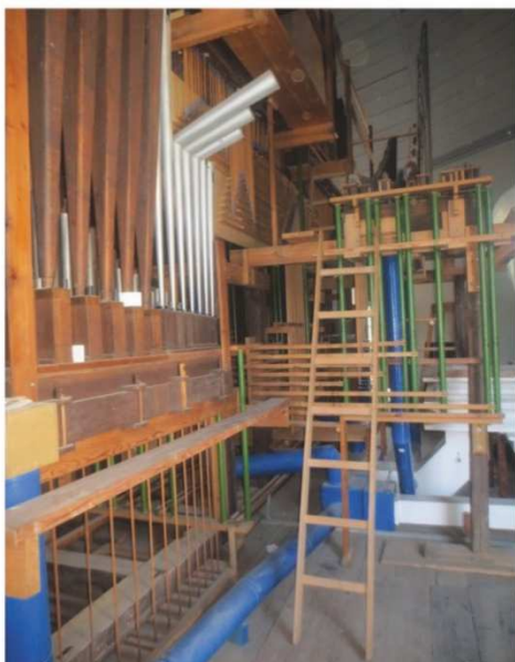
Rückansicht der Orgel – ohne Seitenwände, völlig frei aufgestellt