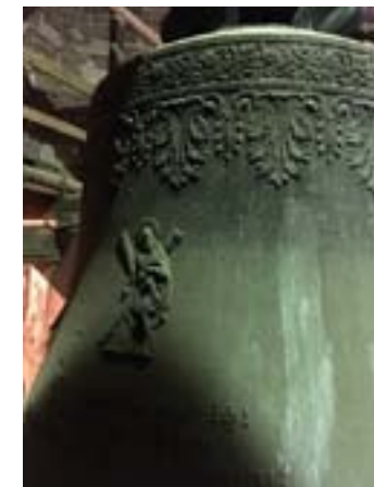
Glocke, Nordturm, St. Andreas, Eisleben