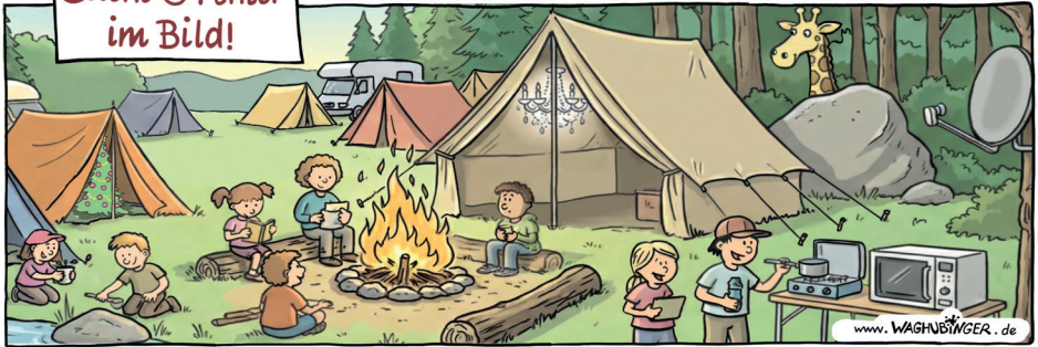
Tannenbaum, Kronleuchter, Giraffe, Mikrowelle, Satellitenschüssel