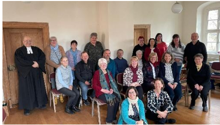
Der Kirchenchor gestaltete Karfreitag in Bennungen den Gottesdienst musikalisch.