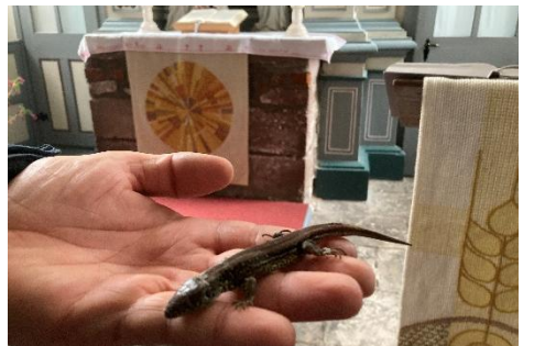
Eine Mauerechse war im Gottesdienst in Tilleda dabei.