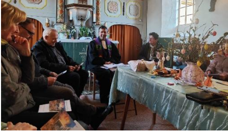
Tischabendmahl an Gründonnerstag in Wolfsberg