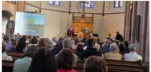
Festveranstaltung in der Kirche mit