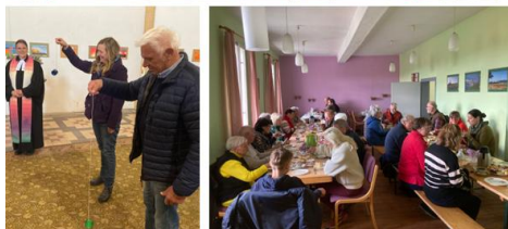
Himmelfahrt in Berga am 14.5.