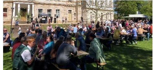
Start mit dem Maifest am Freitag

Roßla feiert das 1030-Jahre-Jubiläum der Ersterwähnung 996