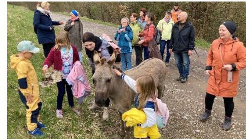
Schafen und einem Esel.