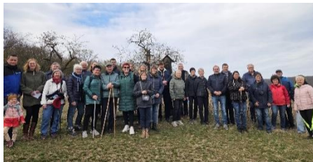
Kreuzweg an Karfreitag zum Wegekreuz am Heiligen Holz