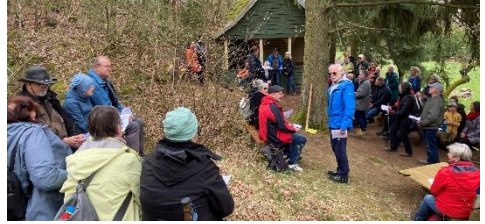
Ein schöner Osterspaziergang und eine fröhliche Andacht in großer