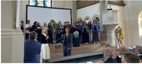
Ein tolles Fest zum Jubiläum 10 Jahre Architekturbüro Hartkopf in