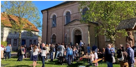
und vor der Bennung Kirche.