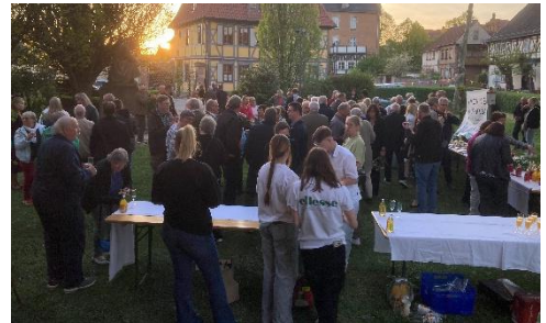
Empfang im Anschluss