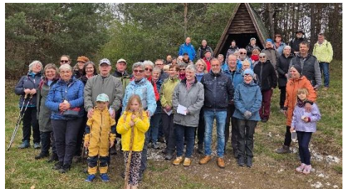
Runde zur Ziegenschwanzhöhle mit