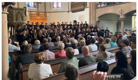
Großartiges Konzert mit „Voces Juvenales“ und „Voces Maturi“.