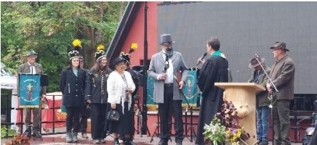
Gottesdienst zum Start des Festes vom Biores (9.5.) an der Heimkehle.