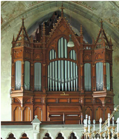
Röver-Organ der Bonifatiuskirche Altenbeichlingen

Singend und klingend in den Sommer – An lauen Sommerabenden erwachen die musikalischen Schätze unserer Region zum Leben. Neun Instrumente der Region Finne-Unstrut werden von verschiedenen Organist/Innen zum Klingen gebracht. Los geht's mit einem Konzert im Schloss Kannawurf am ‚Tag der Natur‘! Den Abschluss bildet eine besondere Orgelmusik mit Lesung für unsere kleinsten Gäste in Sömmerda. Kommen Sie gern vorbei, immer samstags um 17 Uhr! Was gibt es Schöneres, als einen sommerlichen Samstag mit Musik ausklingen zu lassen?