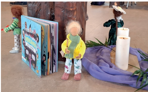
(Text/ Bild: Claudia Fritsche)

Die Pause nutzten viele, um gemeinsam mit dem Tanzkreis aus Sangerhausen das Tanzbein zu schwingen und neue Energie zu tanken. Eine wirkliche Oase im Alltag unserer Heldinnen.